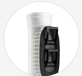
POLO-EHP Control DN 110-630