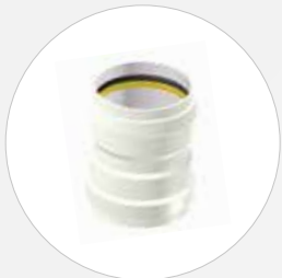
Doppel- und Überschiebmuffe DN 110-1000