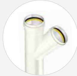
Abzweig DN 110-1000 45° und 90°