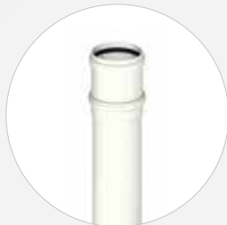
Langmuffe DN 160-630