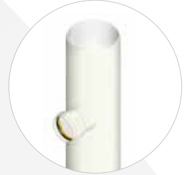
Sohlgleicher Abzweig DN 315-630