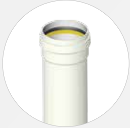
Steckmuffenrohr DN 110-1000