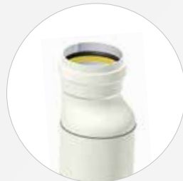
Übergangsrohr DN 110-1000