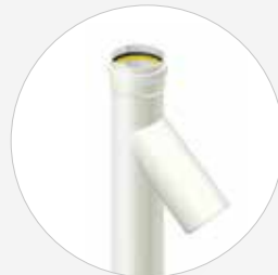
Absturzabzweig DN 160-200