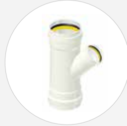
Dreimuffenabzweig DN 160-500