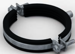
POLO-KAL dB Collier en acier avec garniture en caoutchouc

Si l'isolation phonique revêt une priorité absolue, on utilise POLO-KAL 3S. Le système de canalisation est encore plus silencieux grâce aux nouveaux colliers POLO-KAL dB et POLO-KAL dB+ , qui isolent efficacement les bruits de structure, et garantissent ainsi encore plus de tranquillité.