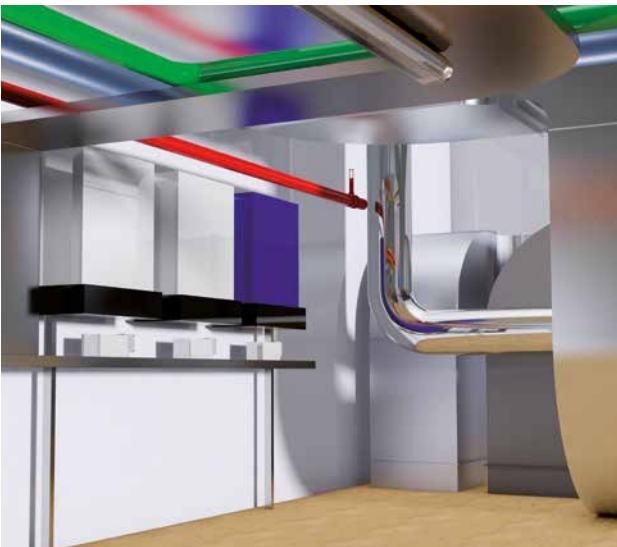
3D-Planung mit BIM

Bei BIM-konformer Planung sind alle relevanten Bauteilinformationen in den einzelnen Elementen des 3D-Gebäudemodells verankert. Diese „intelligenten Bauteile“ können ohne Informationsverlust beispielsweise für energetische oder statische Berechnungen verwendet werden. Das 3D-Gebäudemodell erkennt frühzeitig Kollisionen und vermeidet dadurch Fehler bereits im Ansatz. Sämtliche Informationen sind für alle am Planungsprozess beteiligten Personen jederzeit verfügbar. Die klassischen Prozesse Entwurf, Planung und Ausführung werden in einem dynamisch wachsenden Gebäudemodell vereint.