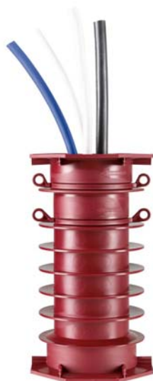
POLO-RDS evolution Rohrdurchführung

Hinweis zur Verwendung von Bildmaterial: Die Verwendung des Bildmaterials zur Pressemitteilung ist bei Nennung der Quelle vergütungsfrei gestattet. Das Bildmaterial darf nur in Zusammenhang mit dem Inhalt dieser Pressemitteilung verwendet werden.