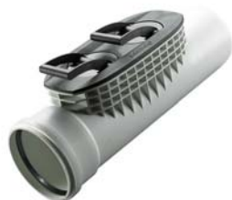
POLO-EHP control für POLO-ECO plus PREMIUM

Starke Marken und mehr als 20 Jahre Erfahrung in PP-Mehrschichttechnologie und viele intelligente Produktlösungen machen POLOPLAST zu einem interessanten Partner für Kunststoffrohrsysteme in Haustechnik, Wasserversorgung und Kanalisation.