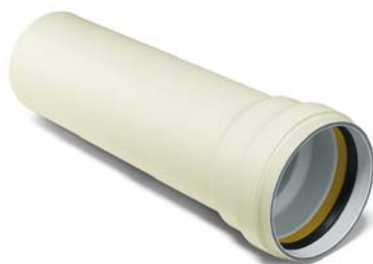
POLO-ECO plus PREMIUM