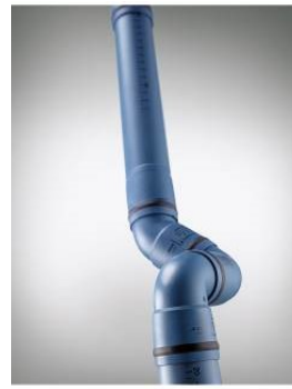
POLO-KAL XS Steckverbindung