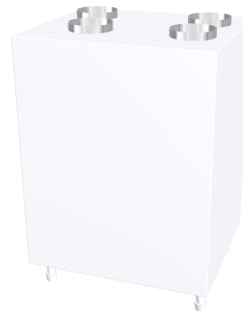
POLO-AIR 390 Wohnraumlüftungsgerät

Als Anbieter von Kunststoffrohrsystemen, Compounds und Polymer-Engineering gilt POLOPLAST mit ihrer 60-jährigen Unternehmensgeschichte als führender europäischer Kunststoffspezialist. Der Schwerpunkt liegt dabei im Bereich Kunststoffrohrsysteme für Haustechnik, Wasserversorgung und Kanalisation. Innovationsgeist, Technologieführerschaft und nachhaltiges Denken und Handeln zählen zu den Markenzeichen des Leondinger Unternehmens.