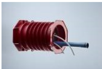
POLO-RDS evolution Rohrdurchführungssystem

Der patentierte, elastische Bereich am Lamellenrohr kompensiert Ungenauigkeiten und Schalungstoleranzen.