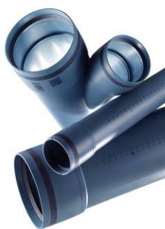
POLO-KAL XS Rohre und Formstücke