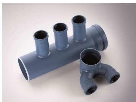
POLO-KAL NG Lüftungsverteiler