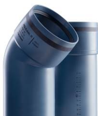
POLO-KAL XS Hausabflussrohrsystem hochschalldämmend