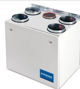
POLO-AIR 450 Wohnraumlüftungsgerät