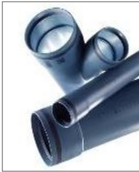
POLO-KAL XS Rohre und Formstücke