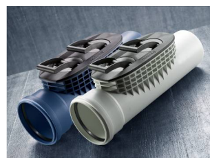
POLO-EHP control für POLO-KAL NG und POLO-KAL 3S