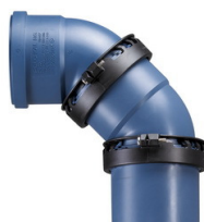
POLO-KAL NG in Verbindung mit POLO-KAL NG ASV