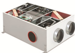
POLO-AIR 250 Wohnraumlüftungsgerät