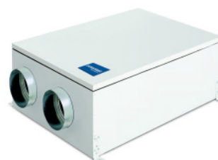
POLO-AIR 250 Geeignet für Wohnungen, Wohnhäuser und kleinere Bürogebäude