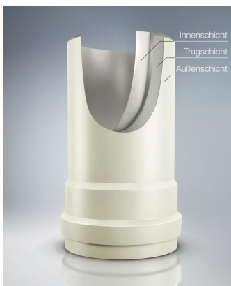
POLO-ECO plus PREMIUM 3-Schicht-Kanalrohrsystem