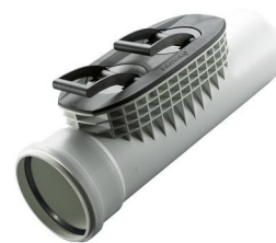
POLO-EHP control für POLO- ECO plus PREMIUM