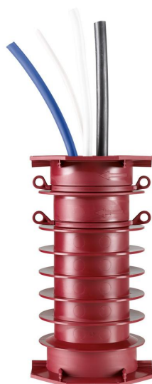
POLO-RDS evolution Rohrdurchführungssystem