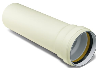
POLO-ECO plus PREMIUM